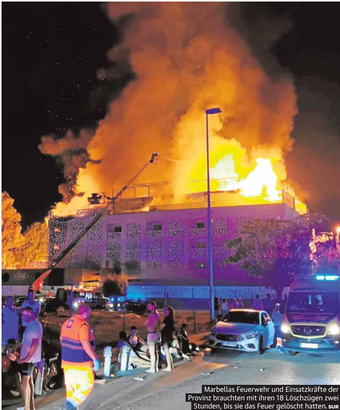
Marbellas Feuerwehr und Einsatzkräfte der Provinz brauchten mit ihren 18 Löschzügen zwei Stunden, bis sie das Feuer gelöscht hatten.