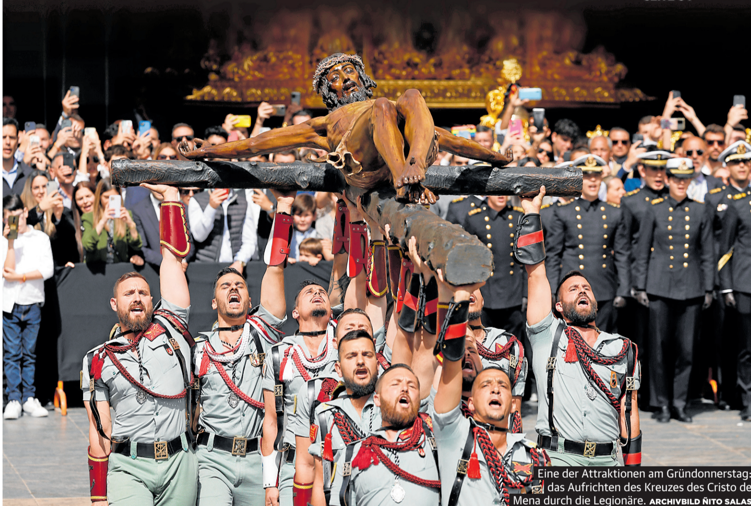
Eine der Attraktionen am Gründonnerstag: das Aufrichten des Kreuzes des Cristo de Mena durch die Legionäre.