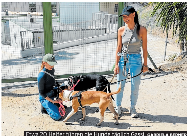
Etwa 20 Helfer führen die Hunde täglich Gassi.