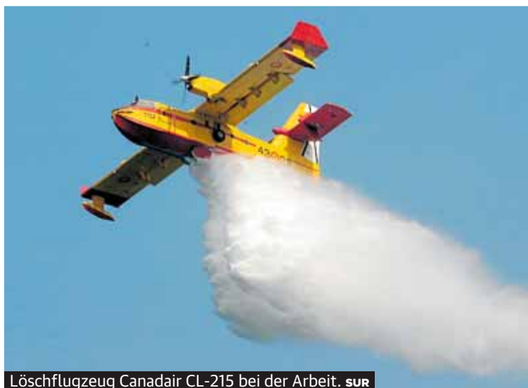
Löschflugzeug Canadair CL-215 bei der Arbeit. SUR

Sie tragen ein Piratenemblem auf ihrer Uniform, denn ihre Einsätze sind verwegend. Unter schwierigsten Bedingungen bekämpfen rund 50 Piloten der '43.' mit ihren Amphibienflugzeugen Waldbrände im ganzen Land aus geringster Höhe. Ihre gelb-roten Flieger, die beim Wassertanken über dem Meer für Aufsehen sorgen, kommen auch an der Costa del Sol immer wieder zum Einsatz. Vom 1. Juni bis zum 31. Oktober ist die Staffel sofort startklar. SEITE 36